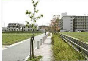
3 百間樋川沿いの緑道