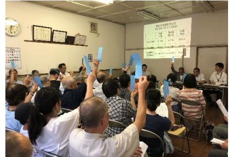
【第1回臨時総会の様子】