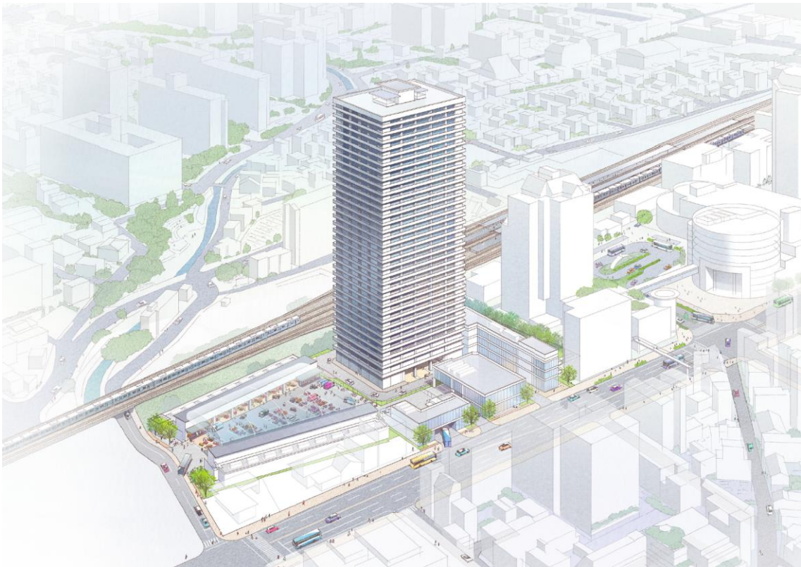
【完成イメージパース】

J R西宮駅南西地区市街地再開発組合事業計画書に基づき、完成イメージパースを作成しました。完成イメージの実現を目標とし、にぎわいと魅力ある都市空間の形成に向け、当事業を進めてまいります。