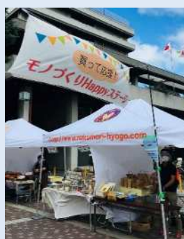
モノづくり Happy ステージ in 西宮市役所前