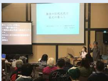
阪神くすの木学級西宮教室