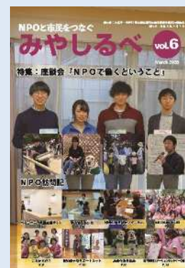
NPO等公益活動 市民団体啓発事業