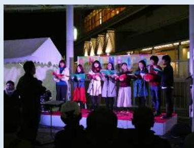
カレッジタウン西宮推進事業 「西宮市大学交流祭」