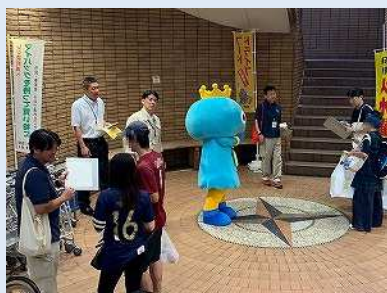
レジ袋削減推進委員会 「レジ袋削減店頭キャンペーン」