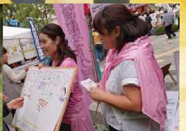
訪問看護ステーションネットワーク西宮 P.12