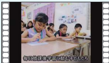
毎日放課後学習に励む子どもたち

NPO法人すくすくあいねが展開する4種の事業について、イベントやコンサートの写真を交えながらスライドショーで紹介しています。