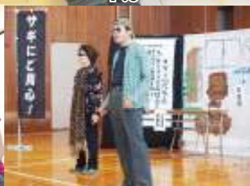
認知症予防サポートネット P.10