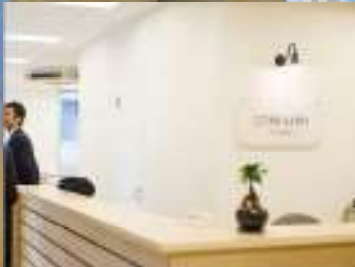
コミュニティ事業支援ネット P.5