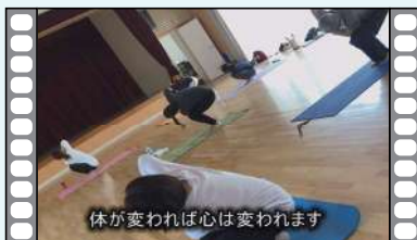
体が変われば心は変わります

フィリピンでの活動の様子をナレーション付きスライドショーで紹介しています。リゾートのイメージがあるセブ島ですが、その裏側には深刻な貧困問題が・・・。