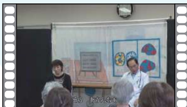
さあ、お話を聞きましょう

健康と体力づくりを応援する運動教室と心に栄養を与える文化講座の様子を動画とスライドショーで紹介しています。