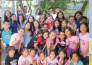
DAREDEMO HERO P.8