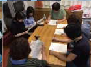
地域生活支援センターれん P.7