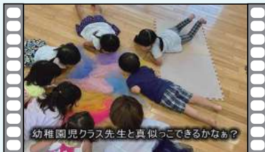
幼稚園児クラス先生と真似っこできるかなあ?

この度、新たな試みとして、本誌 (みやしるべ) に掲載しているNPOの紹介動画を公表する運びとなりました。左記コードが再生リストへアクセスすることができます。