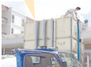
受水槽への注水作業

給水車は水が少なくなった学校を回り、受水槽への注水に専念できます。給水車から直接ポリタンクなどに給水しないため、給水車の各学校での滞在時間が短く、効率的に運用することができます。