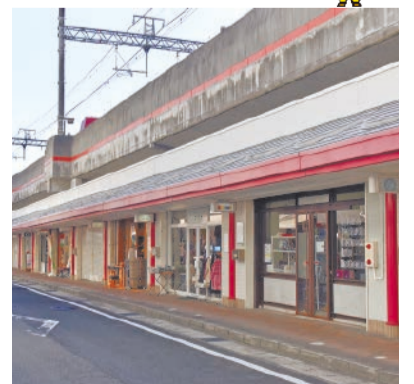
阪急神戸線(若松町)の震災直後の様子(左)と現在の様子(右)。阪神・淡路大震災から30年を迎えました。この機会に防災対策を確認しましょう