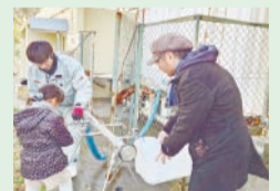
▲応急給水訓練の様子