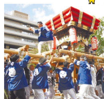
平成16年からは市役所本庁舎周辺で開催。迫力あるだんじりライブは見応え十分