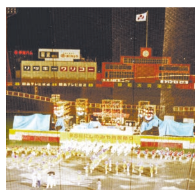
阪急西宮球場で初めて開催した昭和55年の様子。市民会館で前夜祭も行われた