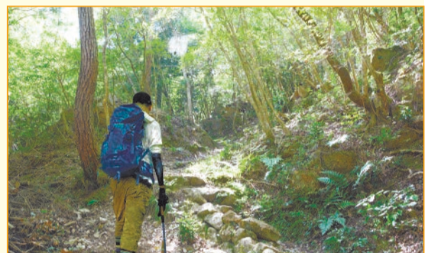
体力に自信のあるあなたは 六甲山登山コース