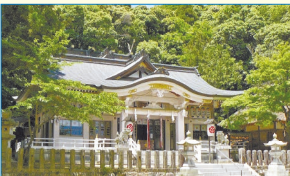
山口町の歴史や文化に触れたいあなたは 神社仏閣巡りコース