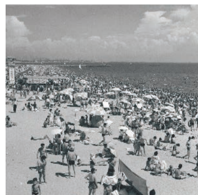
昭和34年の様子。浜辺にはパラソルが立ち、多くの海水浴客が訪れた