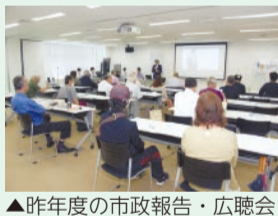
▲昨年度の市政報告・広聴会

また、テーマに関するもののほか、市政全般の意見交換も行います。子供連れでの参加も可能です。ぜひご参加ください。