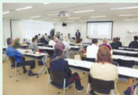
▲昨年度の市政報告・広聴会

また、テーマに関するもののほか、市政全般の意見交換も行います。子供連れでの参加も可能です。ぜひご参加ください。