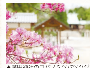
▲廣田神社のコバノミツバツツジ

このツツジ群落は、一時は、環境の変化で縮小していたそうですが、地域の皆さんの保全活動で、現在の景観が維持されています。毎年春には、廣田神社の境内で開花を祝う「つじ祭」が開催され、地元の子供たちによる舞楽「迎陵舞」「胡蝶」が奉納されるなど、多くの市民が集まり、にぎわいます。