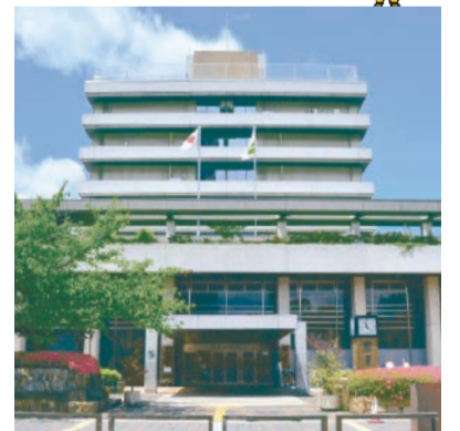
現在の本庁舎は3代目。1階吹き抜けの壁面には市内の見どころのレリーフがある