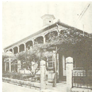
浜久保町(現・久保町)にあった西宮町役場(旧西宮小学校校舎)