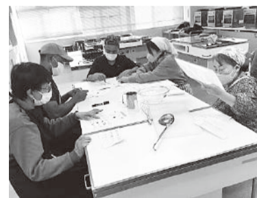
調理実習で「たこやき」を作りながら日本語を学びます