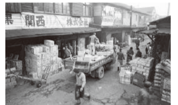
昭和30年代の西宮地方卸売市場の様子

西宮地方卸売市場は、施設の老朽化が著しく、市場運営・衛生面・防災面など多くの課題を抱えていたことから、市街地再開発事業により同市場を再整備しました