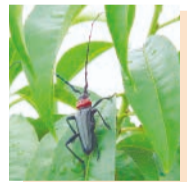
▲クビアカツヤカミキリ

クビアカツヤカミキリは、サクラ・モモ・ウメなど主にバラ科の樹木を好み、枯死させる特定外来生物です。成虫が樹木の中に卵を産み付け、幼虫が木の内部を食い荒らします。もし見つけた場合は、写真を撮影するとともにその場で捕殺し、花と緑の課まで連絡してください。