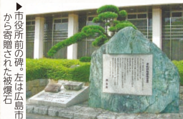
市役所前の碑。左は広島市から寄贈された被爆石

西宮市では平和資料館の他、市内6カ所に平和非核都市宣言碑を設置しています。碑を目にされた際には、周りの方と話題にするなど、改めて平和について考え、平和への思いを未来に受け継いでいただければと思います。