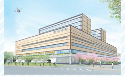
※完成予想図(国道2号からのイメージ)