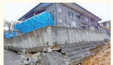
地震の影響で擁壁が崩れ、傾いた家