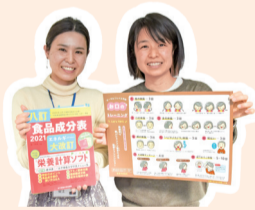
健康増進課 安土 神田 管理栄養士 歯科衛生士