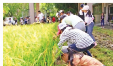
▶ 稲刈りの様子(2018年撮影)

稲刈り作業は大変ですが、みんな自然と笑顔になっていくようです。都市部にありながらも、自然の恵みにかざれていることを感じられるまち、そんな西宮市を目指していきたいと思ひます。