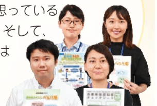
地域共生推進課・地域福祉推進チーム

「自分はまだ大丈夫」と思っている人も、まずは予防から。そして、少しでも不安がある人はぜひご相談ください!