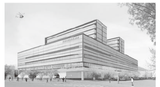
※完成予想図(国道2号からのイメージ)