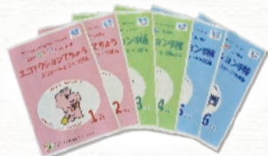
冊子はEWC HPからもダウンロード可

毎年小学生に配布のEWCエコカード。今年はコロナ禍でも取り組めるよう、学校や家庭内での活用に特化した特別版を配布。冊子を上手に活用し、子供も一緒にエコ活動に取り組みましょう！