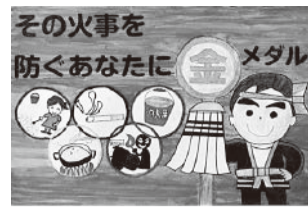
昨年度 最優秀作品

西宮市消防局と西宮市防火保安協会は、火災予防を呼びかけるポスターを募集します。子供たちの火災予防に関する自由な発想を生かした作品をお待ちしています。