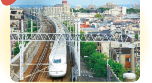
トンネルに入出入りする新幹線を真上から見られる、鉄道好きにおすすめの場所