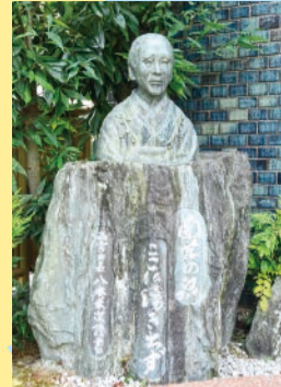
像があるのは、かつて名塩蘭学塾のあったJA兵庫六甲名塩支店前