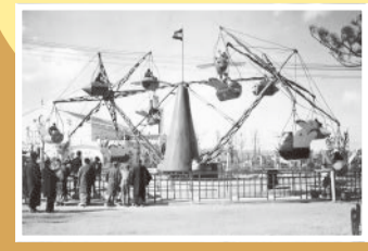
浜甲子園阪神パーク

初代阪神パークは、戦時中の昭和18年(1943年)、飛行場建設のため取り壊されるまで、一大レジャー施設としてにぎわった