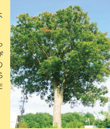
国道176号沿いの山口郵便局横に立つ。市指定天然記念物