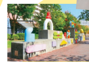
BABY PHOENIX 現代美術家の元永定正さんの「あめかざてんき」など多数の6列植栽の桜並木もみどころ