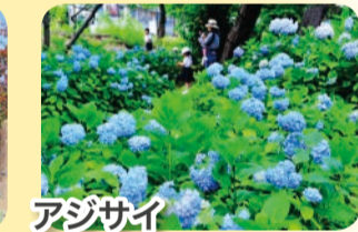
アジサイ 6月頃の阪急苦楽園口駅付近などで見られる