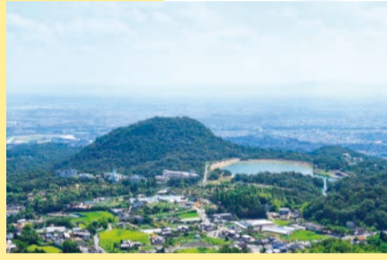
登山道入口は鷲林寺本堂に向かって右側。急な「パノラマコース」等ルートは数種。鷲林寺へは阪急・阪神バスが便利