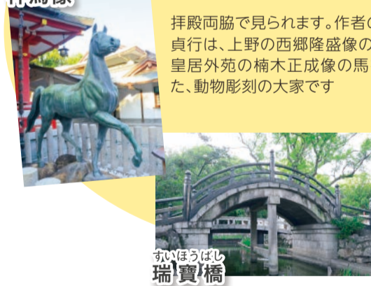
拝殿両脇で見られます。作者の後藤貞行は、上野の西郷隆盛像の犬や、皇居外苑の楠木正成像の馬を作った、動物彫刻の大家です