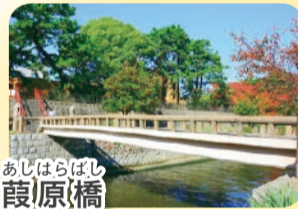
あしはらばし 夙原橋 村上春樹さんの「ランゲルハンズ島の午後」に登場する橋のモデル