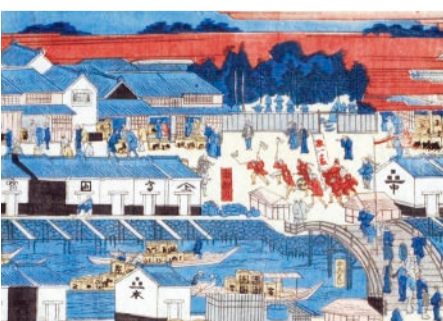
▲「下り酒」の到着を祝う江戸のまち

江戸時代、西宮・伊丹・灘の酒造家たちが良質な米と水、優れた技術を用いて作った上質な酒は、酒輸送専用の樽(たる)廻船で江戸へ届けられました。その酒は「下り酒」という名で称賛され、清酒のスタンダードを築きました。この地域に生き、この地域の発展を願った酒造家たちは、酒造がもたらした富を芸術や教育などに注ぎ「阪神間」の文化を育みました。