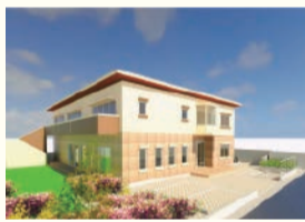
コミュニティ拠点の完成イメージ