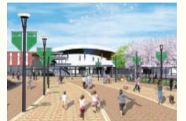
阪神甲子園駅周辺の整備後のイメージ