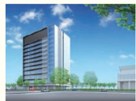
第二庁舎の整備後のイメージ