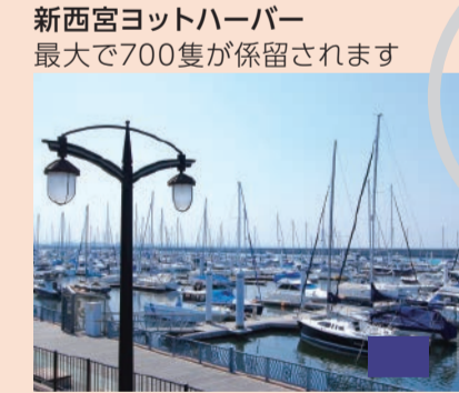
新西宮ヨットハーバー 最大で700隻が係留されます

日本酒の生産地・灘五郷のうち、今津郷・西宮郷がある酒どころだよ。福の神「えべっさん」をまつるえびす神社の総本社「西宮神社」が鎮座するほか、人形操り発祥の地と言われているなど、伝統や文化も感じられるまちだよ。