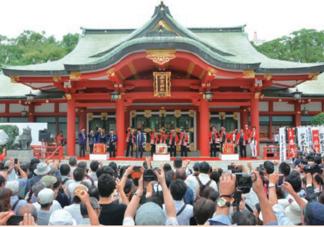
西宮神社「酒づくりとえべっさん」のまんな