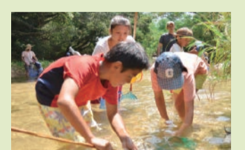
仁川上流 魚やカニ類、エビ類も生息しています

市のシンボルである「甲山」の自然に囲まれたまちだよ。甲山のふもとの上ヶ原地区は、全国で2番目の「文教地区」に指定された地区で、幼稚園から大学までたくさんの学校があるよ。