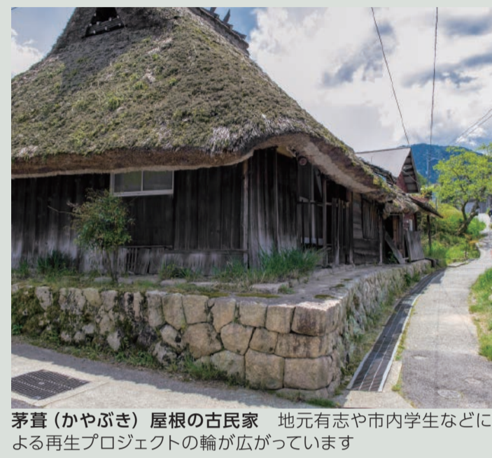
茅葺(かやぶき)屋根の古民家 地元有志や市内学生などによる再生プロジェクトの輪が広がっています