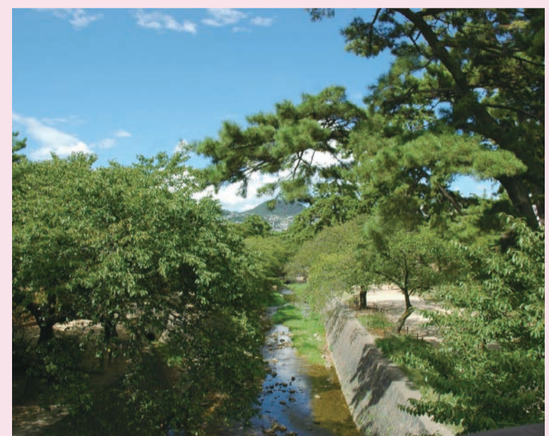
夏の夙川公園 桜が有名ですが、夏の緑も別の美しさがあります