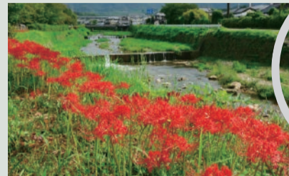
有馬川緑道 ホタル、桜、彼岸花と季節ごとの見どころがたくさんあります

まちなかの近くでも棚田や蓬萊峡などの自然があふれていて、そのまちなみを活かして、「船坂マルシェ」や「船坂ピエンナーレ」などの催しが行われているよ。金仙寺湖周辺は、桜や紅葉がきれいでウォーキングスポットとしても人気なんだって！