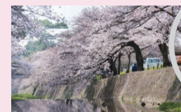
春の夙川公園 美しい桜並木が約2.8kmにわたって続きます

日本さくら名所100選にも選ばれている「夙川公園」や、国の都市景観大賞を受賞した「甲陽園目神山地区」のある憧れのまちだよ。夙川から苦楽園に向かう越木岩筋には、パンやスイーツ、カフェ、雑貨など、おしゃれでおいしいお店がたくさん！