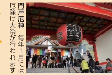
門戸厄神 毎年1月には厄除け大祭が行われます

関西で住みたいまちナンバー1・阪急西宮北口駅周辺。県立芸術文化センターなどの文化施設や、みやこキッズパークなどの子供の遊び場、大型商業施設もあるアメニティ豊かなまちだよ。