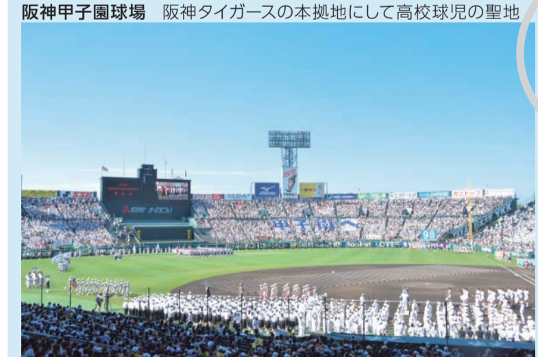
阪神甲子園球場 阪神タイガースの本拠地にして高校球児の聖地