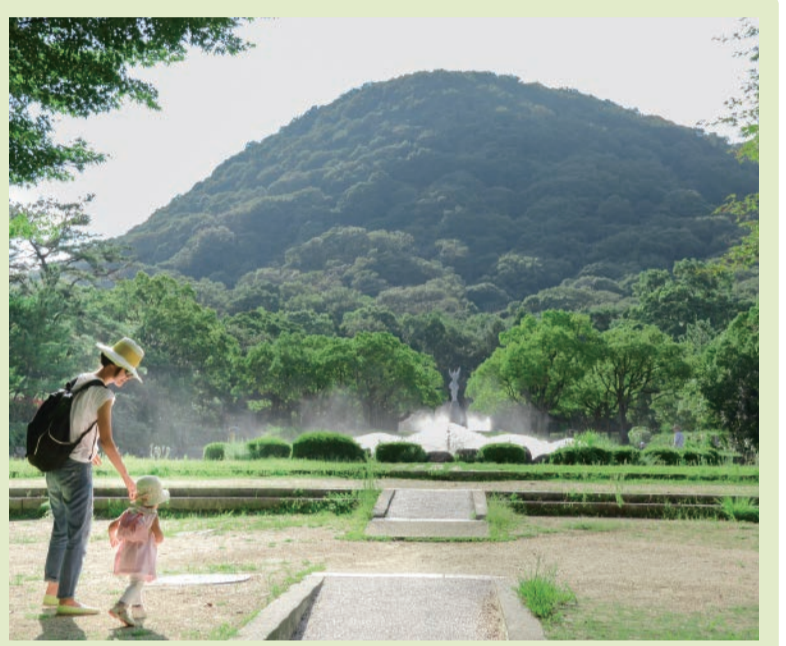
甲山森林公園 甲山を間近に見ることができます

市のシンボルである「甲山」の自然に囲まれたまちだよ。甲山のふもとの上ヶ原地区は、全国で2番目の「文教地区」に指定された地区で、幼稚園から大学までたくさんの学校があるよ。