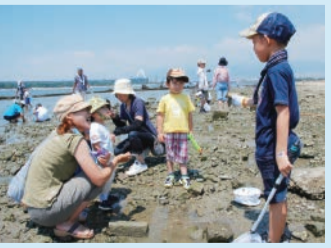
甲子園浜 阪神間に残る貴重な自然の砂浜です