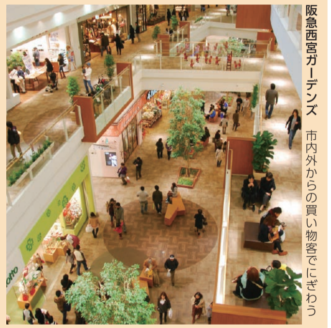
阪急西宮ガーデンズ 市内外からの買い物客でにぎわう

関西で住みたいまちナンバー1・阪急西宮北口駅周辺。県立芸術文化センターなどの文化施設や、みやこキッズパークなどの子供の遊び場、大型商業施設もあるアメニティ豊かなまちだよ。