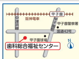
西宮歯科総合福祉センター