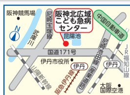
阪神北広域こども急病センター