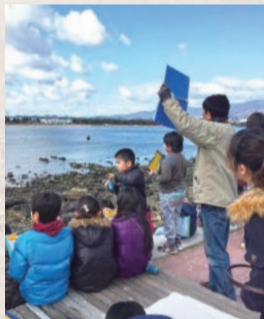
▲南甲子園小学校3年生の冬の渡り鳥観察会など、環境学習への協力なども行っています

すぐそばの自然環境センターでは望遠鏡で浜の野鳥を観察できるほか、小さな水族館なども楽しめます。ぜひ“憩いの場”甲子園浜に遊びに来てください。