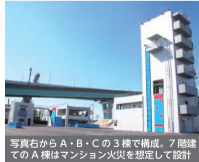
写真右からA・B・Cの3棟で構成。7階建てのA棟はマンション火災を想定して設計