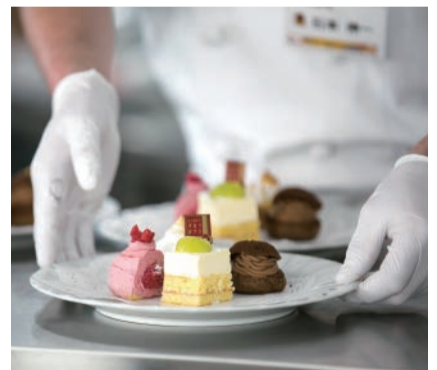
▲昨年の西宮Sweets Liveの様子

KATAOKA、カーベ・カイザー、Daisy、トシヒロ タダノ、長崎伸栄堂、パルテール、ファミリー、Patisserie Fil、ボルドー、ヨシミ、ラ・パニーユ、ラ・フィーユ、リベロ