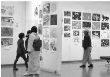
子供から大人まで楽しめます