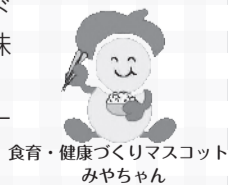
食育・健康づくりマスコット みやちゃん

朝食から1日をスタートさせているあなた。朝食の習慣があることはいいことです。次は、食べる内容にも目を向けてみませんか。元気な体を作る食事の基本は、炭水化物、タンパク質、ビタミン・ミネラル(野菜・果物)、アブラがそろっていること。朝食にもこれらがそろって意識してみてください。例えば、ドーナツとコーヒーにはフルーツヨーグルトをプラス。サンドイッチに野菜スープ、納豆ごはんは具だくさん味噌汁などもいかがでしょうか。忙しい朝ですが、栄養バランスのとれた朝食で元気な1日をスタートさせてみませんか。