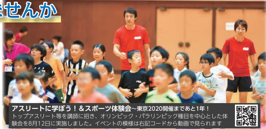
アスリートに学ぼう！&スポーツ体験会～東京2020開催まであと1年！ トップアスリート等を講師に招き、オリンピック・パラリンピック種目を中心とした体験会を8月12日に実施しました。イベントの様子は右記コードから動画で見られます