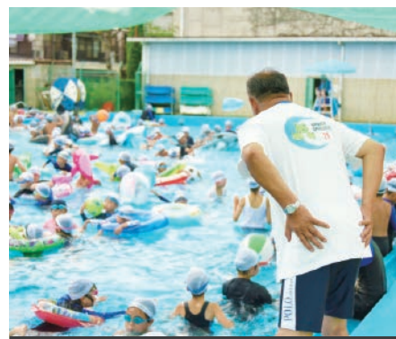
樋ノ口小学校のプール開放 今年度初日には約230人の子供たちが参加。クラブの皆さんが協力して、安全管理、塩素濃度や水温の調整などを行っています