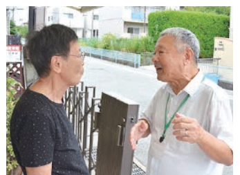
▲民生委員による訪問の様子