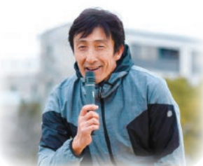
アスレチック・リエゾン・西宮(※) 会長 朝原宣治さん (大阪ガス・北京五輪陸上銀メダリスト) (※)市と縁(ゆかり)あるアスリートやスポーツ団体等で構成された、市と協働でスポーツを通じたまちづくりを行う異競技連携組織

市ではさまざまな団体、アスリート個人が活躍しており、競技も多岐にわたります。競技の垣根を越えて、国や自治体、企業などが協力し、大いにスポーツに興味を持ち体験してもらえよう、我々アスリートも努力し続けたいと思います。