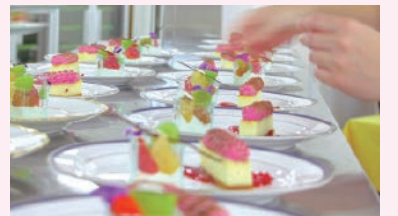
▲昨年の西宮Sweets Liveの様子

西宮洋菓子ブランド発信事業実行委員会は、「西宮洋菓子園遊会～西宮Sweets Live」への参加者を募集します。市内洋菓子店のパティシエが一堂に会し、各パティシエが趣向を凝らしたアシェットデザート(お皿に盛りつけられたデザート)をコースで提供します。