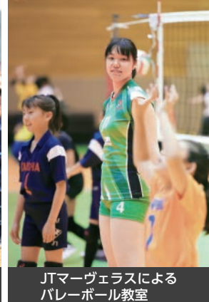
JTマーヴェラスによるバレーボール教室