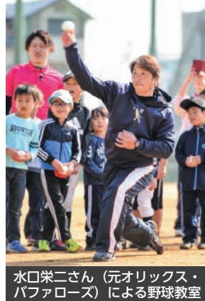
水口栄二さん(元オリックス・パファローズ)による野球教室