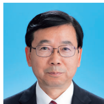
八代 毅利 (63) 公明党議員団 花園町