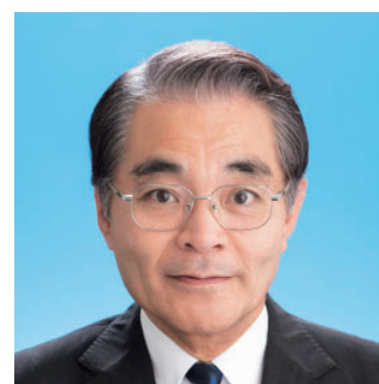
大川原 成彦 (61) 公明党議員団 田代町