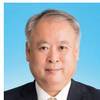
町田 博喜 (64) 公明党議員団 高須町1丁目