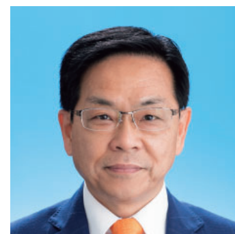
山田 ますと (58) 公明党議員団 甕岩町