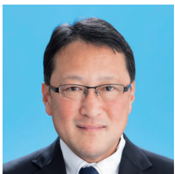
松山 かつのり (52) 公明党議員団 津門住江町