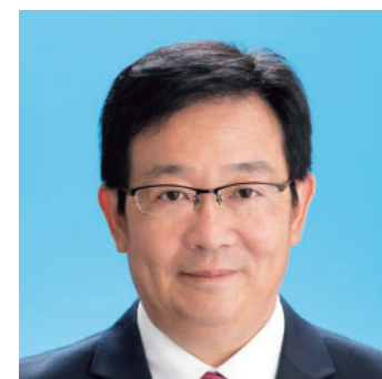
山口 英治 (55) 公明党議員団 能登町