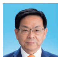
山田 ますと (58) 公明党議員団 甕岩町