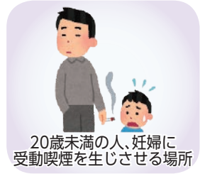
20歳未満の人、妊婦に受動喫煙を生じさせる場所