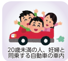
20歳未満の人、妊婦と同乗する自動車の車内