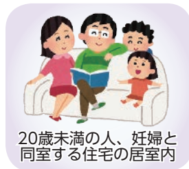
20歳未満の人、妊婦と同居する住宅の居室内