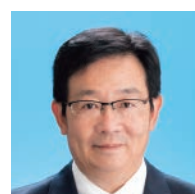
山口 英治 (55) 公明党議員団 能登町