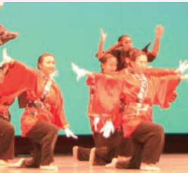
昨年のステージの様子

募集要項・申込書は、6月25日から市民協働推進課(市役所本庁舎7階)、各支所・市民サービスセンター、アクタ西宮ステーションで配布するほか、にしのみや市民祭り協議会のホームページ(https://www.nishinomiyashiminmatsuri.jp/)からダウンロードできます。