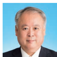
町田 博喜 (64) 公明党議員団 高須町1丁目