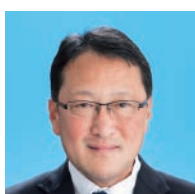
松山 かつのり (52) 公明党議員団 津門住江町