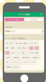
地域×キーワードでの検索が可能に!