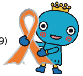
オレンジリボンマークは児童虐待防止のシンボルです

未来へと命を繋ぐ 189(いちはやく) 問 子供家庭支援課(0798・35・3089、3749)