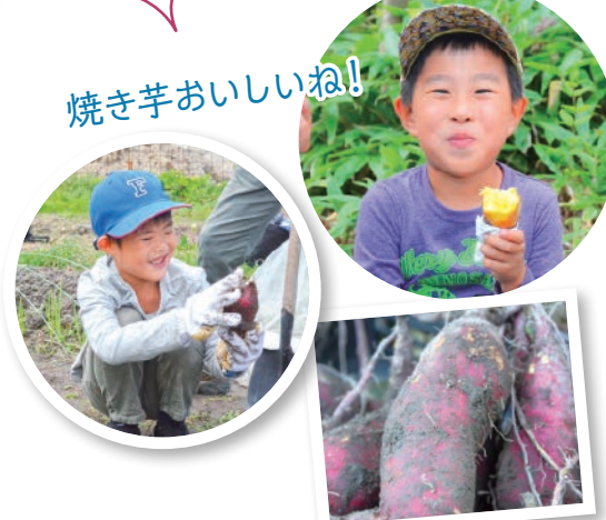
焼き芋おいしいね！