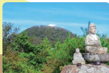
第68番札所からの眺め

甲山と社家郷山にはそれぞれキャンプ場があります。市街地からほど近い場所で、火を使った体験ができる貴重な施設です。 ※甲山キャンプ場は3月15日まで休場