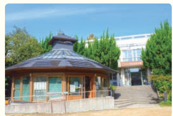
自然学習館と自然の家

甲山自然環境センターは4つの施設で構成されています。キャンプ場2カ所のほか、甲山の自然や成り立ちについて学べる「自然学習館」、宿泊施設の「自然の家」があります。