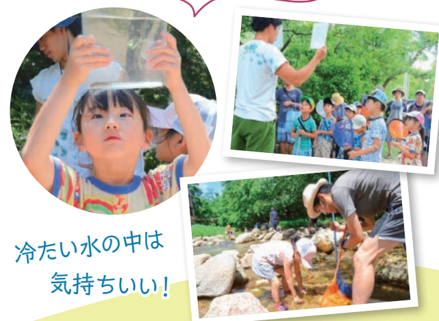
冷たい水の中は気持ちいい！