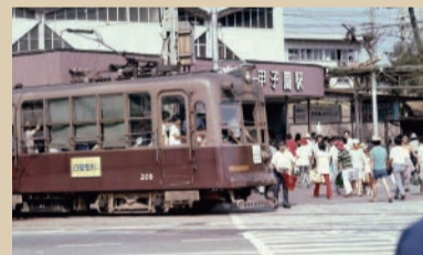
路面電車が走る阪神甲子園駅前(昭和29年)

西宮市に生まれ育った人は懐かしさを、新たに西宮市に来られた人は驚きをもって楽しんでもらえることと思います。