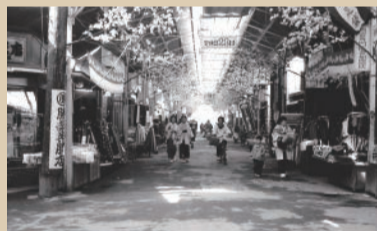
中央商店街(昭和34年)