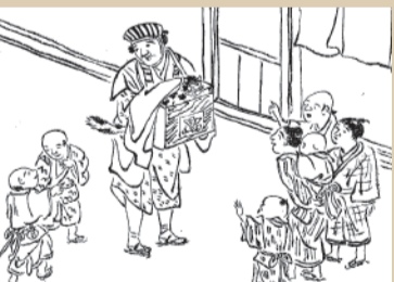
描かれた俵置師(人形操り発祥の地らしく)