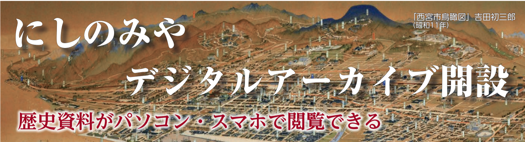
「西宮市鳥瞰図」吉田初三郎 (昭和11年)