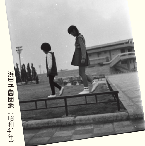
浜甲子園団地 (昭和41年)

路地裏、ご近所など生活の中で撮られた何気ない1枚が、街の歴史を伝える貴重な資料になります。市は、皆さんがお持ちの西宮の街の懐かしい写真やパンフレットなどを募集しています。