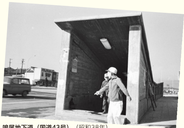
鳴尾地下道 (国道43号) (昭和38年)