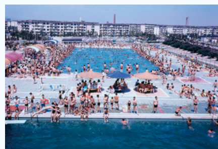
たくさんの人でにぎわった厚生年金プール (昭和44年)

【日時】8月21日(日)、9月4日(日)の午後1時、3時～ ※阪神パーク、昭和30年代の市政だよりを上映