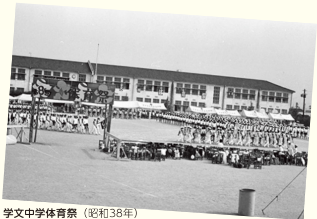
学文中学体育祭 (昭和38年)