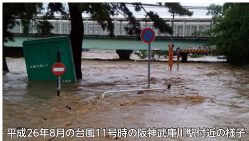
平成26年8月の台風11号時の阪神武庫川駅付近の様子

6月は「土砂災害防止月間」です。昨年の「鬼怒川氾濫(茨城県常総市)」、一昨年の「広島土砂災害」など、近年大雨による大災害が頻発しています。西宮でも、武庫川が氾濫した場合の洪水浸水想定区域は阪神西宮駅以西に及び、土砂災害警戒区域は市の北・中部に点在しています。詳細は防災マップ=下記事=で確認できます。