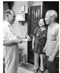
民生委員・児童委員は地域に欠かせない存在です