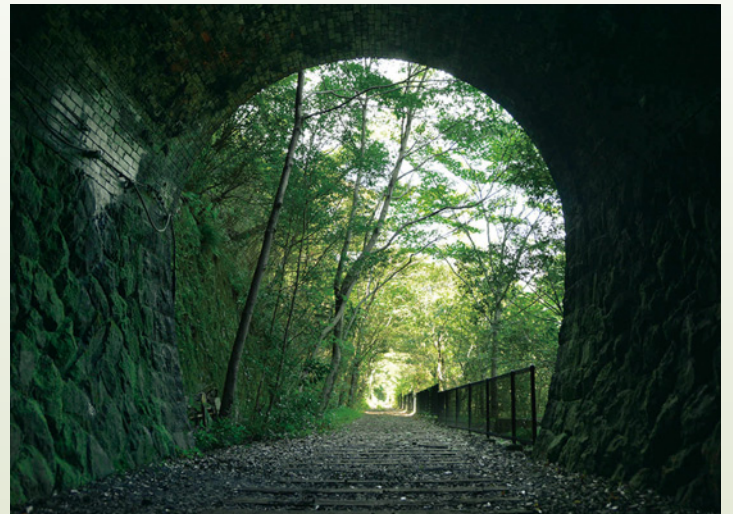
▲枕木が続くハイキングコース