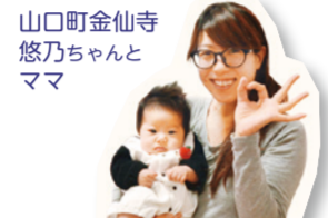
ホームページ西宮山口より