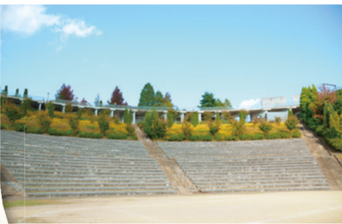
東山台 東山台小学校のママ3人組