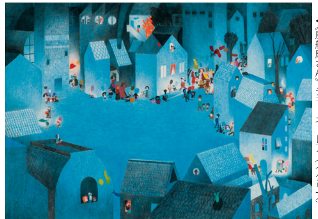
▲《風船屋さん》シモーネ・レア(イタリア)