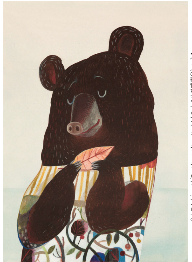
▲《5人の動物たち》マリアキアラ・デイ・ジョルジョ(イタリア)