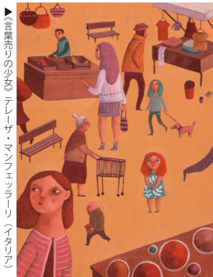
▶《言葉売りの少女》テレザ・マンフェッラーリ(イタリア)