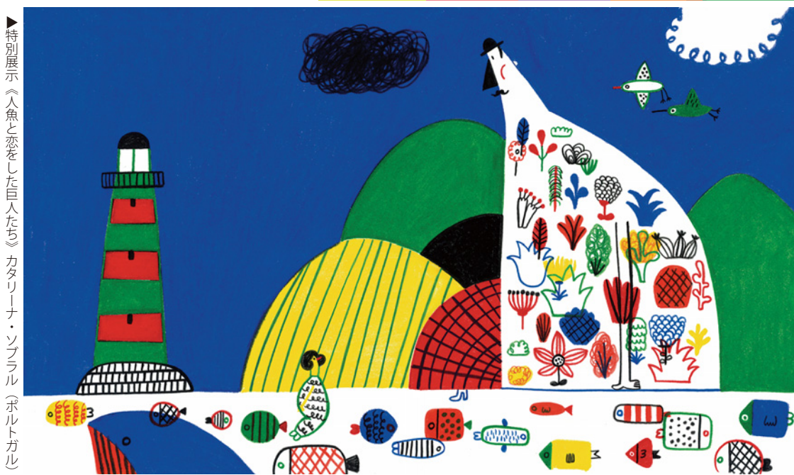
▶特別展示《人魚と恋をした巨人たち》カタリーナ・ソプラル(ポルトガル)