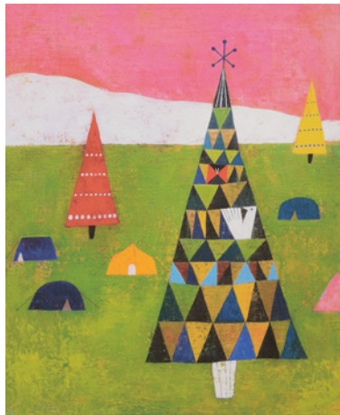
▲《今度の休日》乾 真徳(日本)