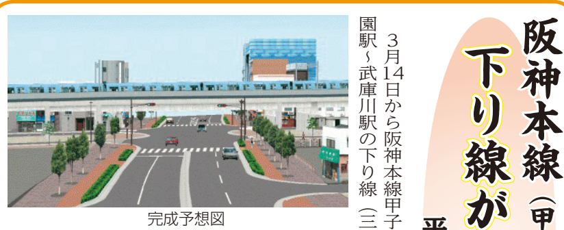
完成予想図 北から南方向を見る小曾根線付近

【対象】 4月1日以降に妊婦健康診査費用助成券を申請する人 【助成総額】 8万2000円 (上限1万1000円券2枚、上限5000円券12枚) 《平成26年度中に申請した人へ》 平成27年4月1日以降に妊婦健康診査費用助成券を使用する人を対象に、補助券を送付し、27年度申請者とほぼ同額の助成総額となるように経過措置を実施します。現在持っている受診助成券と併せて使用してください。 詳しくは補助券と同封されている案内または市のホームページ（くらしの情報→健康→妊産婦）をご覧ください。 ※対象者で4月1日時点で補助券が届いていない場合は、地域保健課（0798・35・3302）へ連絡してください