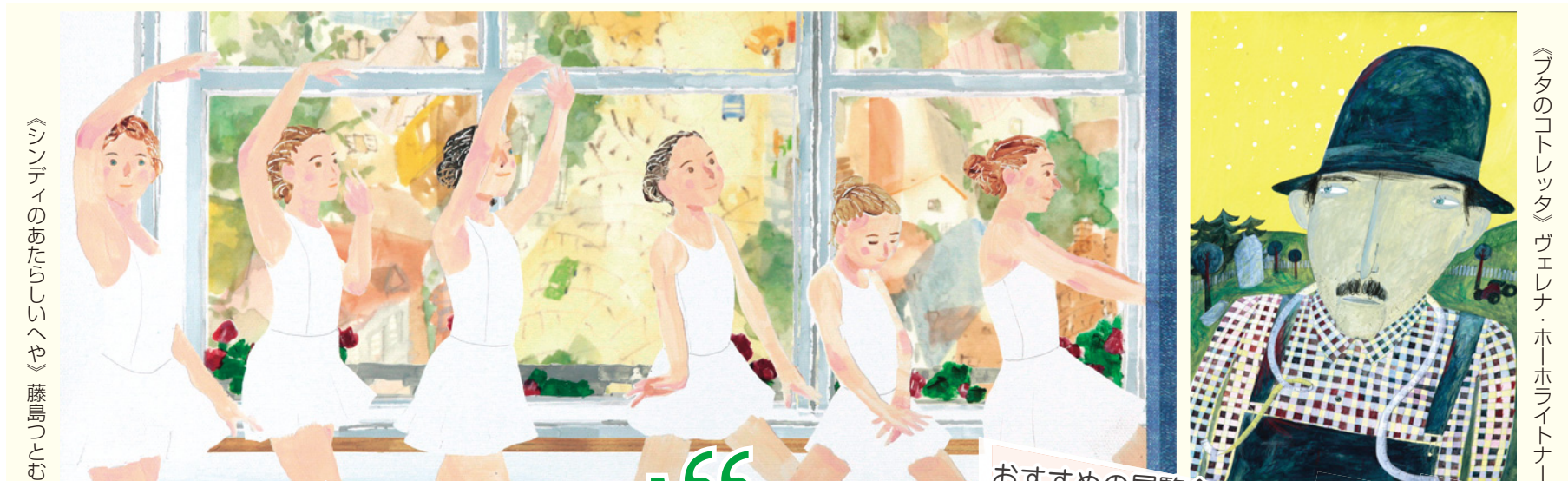
《シンディのあたらしい日々》藤島しづむ