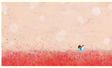
刀根里衣『ぴっぽのたび』(Ediciones SM, 2014)