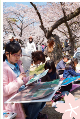
桜の下でスケッチに熱中

ぐるっとお花見ウォーク 午前9時半〜10時半に苦楽園口駅南東河川敷で受付。随時出発。桜の名所を巡る約8・8キロ。小学生以下は保護者同伴で参加を。筆記具持参。小雨決行