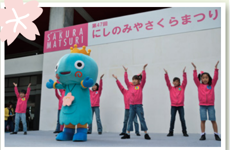
みやたんがステージでダンスを披露

オープニングイベント 午前11時から夙川公民館前で。ウエルカム演奏や「みやたんダンス」の披露のほか、振る舞い酒など 観桜茶会 午前10時〜午後3時に片鉾池北側(雨天時は夙川公民館)で。抹茶和菓子を楽しめます(無くなり次第終了)。要参加費 さくらFM(8・FMメガヘルツ) による中継 午前11時〜午後4時に夙川公民館前で。イベント中継や出演者来