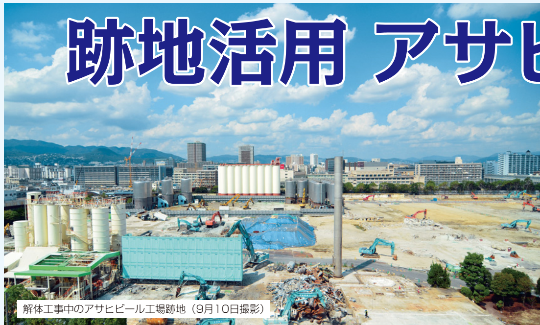
解体工事中のアサヒビール工場跡地（9月10日撮影）

今後、市が予算に関する議会承認を得たうえで整備する公共施設の配置計画や跡地活用事業の進め方などについて大筋の合意に達しましたので、その概要をお知らせします。問合せは都市政策課（0798・35・3485）へ。