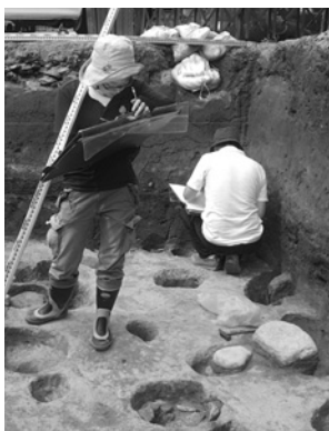
西宮神社頭遺跡での発掘調査

これまででは、文化財の種類ごとに部分的な調査を実施して指定文化財の候補物件として、対処が必要な埋蔵文化財の緊急調査を実施することが大部分を占めていました。今後は、地域ごとに指定・未指定を問わず寺社を核とした総合調査などを行い、市内の文化財基