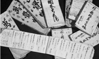
今津灯台(市指定・建造物) 岡本家文書(市指定・古文書)

西宮市文化財保護条例では、「文化財とは、西宮市の区域内において、市民の文化向上に貢献できる文化的所産ならびに学術上価値の高い動物、植物及び鉱物地質を指す」としています。第3条には、文化財として4つの種類(有形文化財、無形文化財、民俗文化財、記念物)が掲げられています。