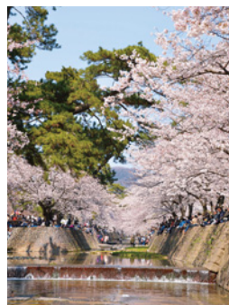
マナーを守って楽しい花見にしましょう

夙川公園を含む市内の公園では、物品等を販売する商行為、パーベキュー等による火気使用、カラオケ、場所取りなど、他の来場者や近隣住民に迷惑のかかる行為は禁止されています。また、西宮市道上での物品等を販売するために道路を占有することは原則として認められません。問合せは公園については公園緑地課(0798・35・3611)、市道については土木管理課(0798・35・3634)へ。