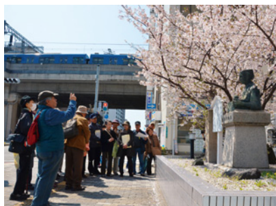
昨年行われた「西宮歴史散歩」の様