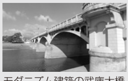
モダニズム建築の武庫大橋

◆ホームページで動画配信 3月18日から市のホームページ(広報にしのみや)にしのみやインターネットテレビで動画を視聴できます