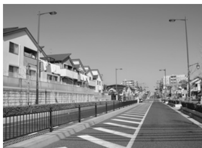
市道の無電柱化について整備計画を策定

●学校施設空調設備整備事業 ●学校施設耐震補強事業 ●アサヒビル西宮工場跡地等まちづくり検討事業 ●中央病院経営健全化の推進 ●地域防災計画等関係事業 ●（仮称）総合防災センター整備事業 ●都市計画道路の整備 ●通学路や歩道の安全対策 ●西宮市総合交通戦略策定事業 ●鉄道駅舎バリアフリー化推進事業