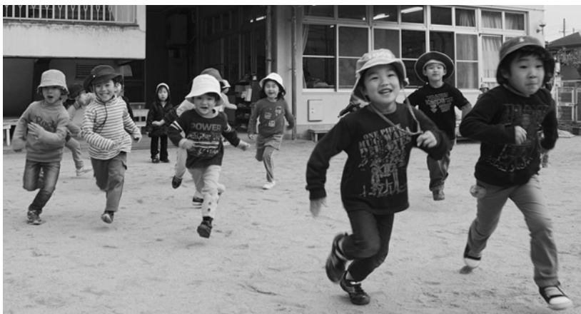
子どもたちの健やかな成長のためにさまざまな取り組みを進めます

●保育所待機児童対策 ●教育連携事業 ●私立幼稚園就園奨励金の増額 ●学校給食費の公費化 ●学校施設耐震補強事業 ●児童館の整備