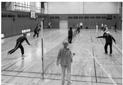
誰もがスポーツを楽しめる環境へ

●市民会館エレベーター棟の新設 ●西宮市スポーツ推進計画の策定 ●「西宮市スポーツ基本法の趣旨を踏まえ、市民アンケートの分析結果も活用し、「西宮市スポーツ推進計画」を策定する ●中央体育館・武道場部分冷房設備整備事業 ●アイススケートリンク利用促進事業 ●市民無料招待デー等を実施する