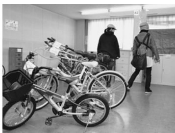
新しい持ち主を募集しています