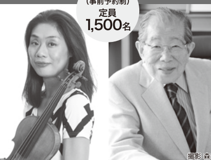
参加無料(事前予約制) 定員1,500名

日時 4/10(水) 13:00~15:30 場所 兵庫県立芸術文化センター KOBELCO 大ホール 〒663-8204 兵庫県西宮市高松町2-22 (阪急西宮北口駅から徒歩で直結)